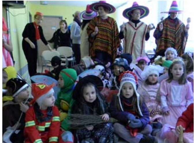
Pisan zbor mask iz Vrtca v Topolšici

V četrtek, 3. marca, pa so nam popoldan popestrile avtohtone maske iz Šoštanja. Zbrali smo se v večnamenski dvorani in jih navdušeno pozdravili, saj so si to tudi zaslužili. Prišli so tresimirji in šoštanjski koši. Tresimirji so bili narod, ki je živel v nerodovitnih, mrzlih krajih. Preseljevali so se do naših krajev, kjer so bili oblečeni v živalske kože, za obrambo pred vročino in dežjem so bili pokriti s širokokrajnimi klobuki, obuti so bili v cikle, v rokah pa so držali palico, okrašeno z živalsko lobanjo. To so bile prijazne maškare.