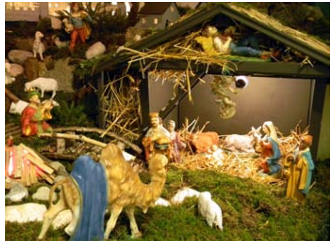
Jaslice so bile kot mesto Betlehem v malem.

so iz različnih krajev prihajali bolniki s TBC, tuberkulozo. Bolniki so se zdravili in mnogi tudi ozdraveli. Tamše se je razgovoril o veliki družini obeh starih staršev. Bili so delavni in so složno živeli. Obširno je opisal svoje življenje, šolanje in povedal je, kako je dobil kvalifikacijo v RŠC. Pomagal je graditi prvo velenjsko skakalnico. Veliko je prispeval za razvoj Topolšice.