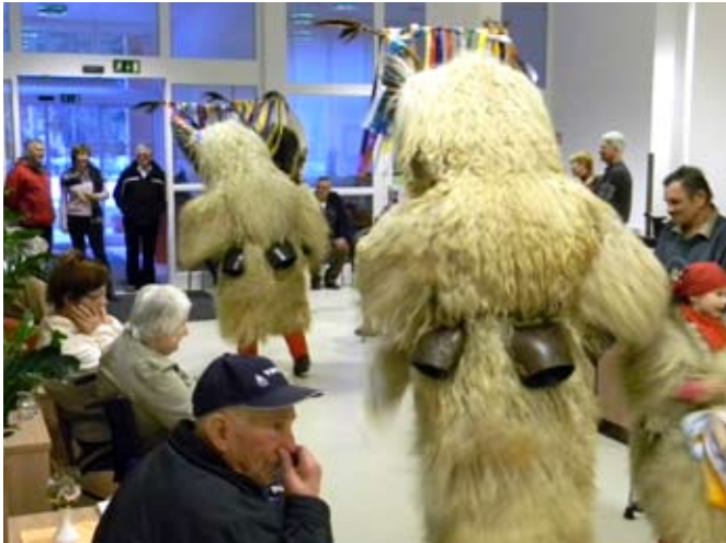
Ptujski kurenti so uspešno odgnali zimo.

V Zimzelenu smo kar zgodaj začeli s pustnimi dogodivščinami. Najprej smo že v sredo, 2. marca, spekli flancate in se z njimi posladkali ob čaju.