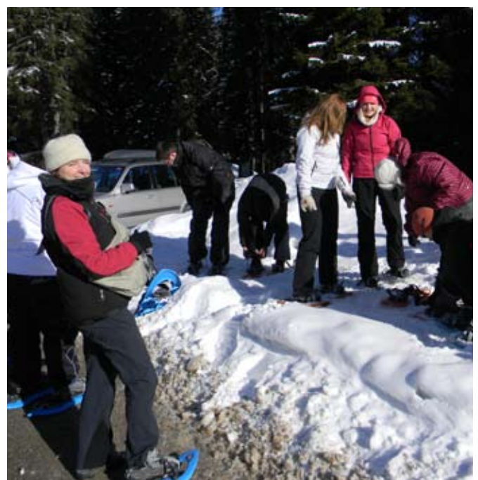
Obuvanje v krplje

Hitro smo spoznali, da pri hoji s krpljami nog ne moreš imeti skupaj, ampak hodiš, kot bi imel polne hlače, da je treba držati varnostno razdaljo, saj smo sicer pohodili in prekucnili v sneg tistega pred nami, pa tudi pri obračanju na mestu se je treba prestopiti s celimi no-