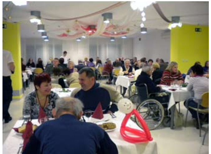
V srečno novo leto s svojimi domačimi

Po predstavi pa so v večnamenski dvorani za skupno mizo sedli stanovanci s svojci in delom osebja. Skupno smo se pozdravili in nato uživali okusno hrano, ki so jo pripravile kuharice. Vzdušje je bilo slovesno. Tudi glasba je spremljala naše praznovanje, kajti še so zveneli nežni zvoki citer. V štirih dnevni prostorih pa so se zbrali tisti stanovanci, katerih svojci niso bili prisotni. Tako kot v dvorani je bilo enako slovesno v dnevnih prostorih. Naše gospodinje so stregle in se resnično ravnale po protokolu. Večerja je bila slovesna in vsi smo se dobro počutili. Tudi zapeli smo in si za slovo rekli: »Hvala, lepo je bilo in vsem srečno novo leto!« Legenda pravi, da so Sveti trije kralji Gašper, Miha in Boltežar – G + M + B – zagledali na obzorju svetlo zvezdo, repatico, in ta jih je