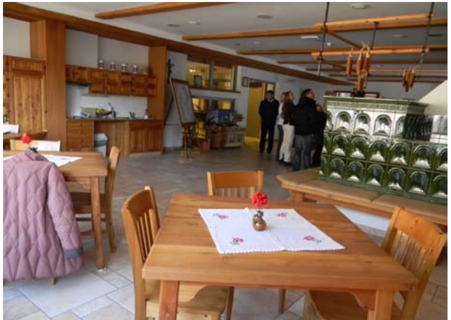
Vhodna avla doma Sv. Mihaela s krušno pečjo