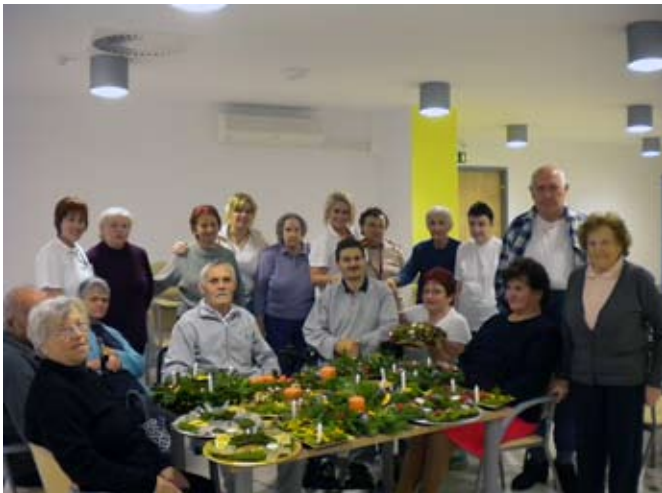
Center smo okrasili z adventnimi venčki, ki smo jih sami ustvarili.

Od 8. do 18. decembra smo v vseh prostorih imeli zaporo, saj so se v celem centru pojavili bolniki. Prek 60 jih je ležalo z drisko in bruhanjem. Nekateri so ležali po 3 do 4 dni. V domu je zbolelo tudi precej članov osebja. Stanovalci smo si tudi med seboj pomagali. Kuhinja je nudila prežganko, prepečenec, limone in banane, pozneje tudi čokolado. Viroza – smo rekli – je nekatere bolnike izsušila. Izgubili so tek za hrano.