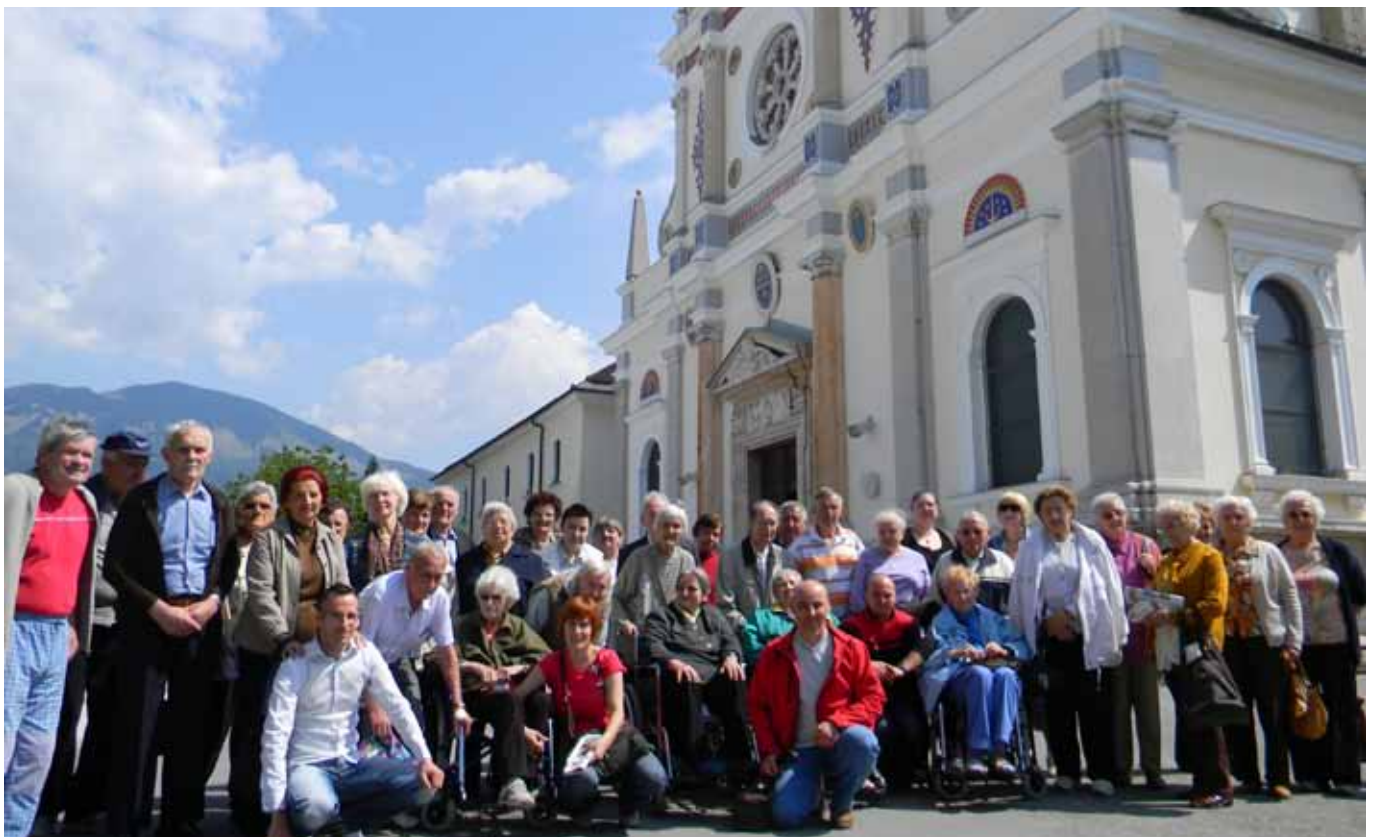
Pred cerkvijo Marije Pomagaj na Brezju

Gremo na izlet! Kdo se tega ne veseli? A kam? Slovenija je lepa dežela, polna zanimivosti. Možnosti je torej veliko. Žal so nekateri kraji predaleč, nekatere znamenitosti težje dostopne. In ne nazadnje, kadar koli smo stanovalce pobarali, kam bi želeli iti na izlet, je vedno izstopalo ime Brezje. Bomo zmogli, ne bo predaleč, ne bo prenaporno, smo spraševali? Bomo, ne bo. Gremo na izlet na Brezje, je padla odločitev.