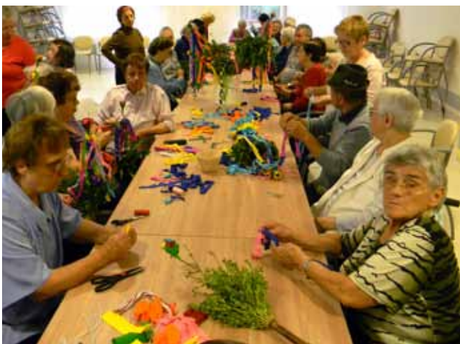
Ob izdelovanju butaric smo se razvedrili in zabavali.