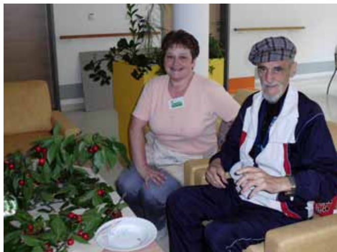
Ema in Fery