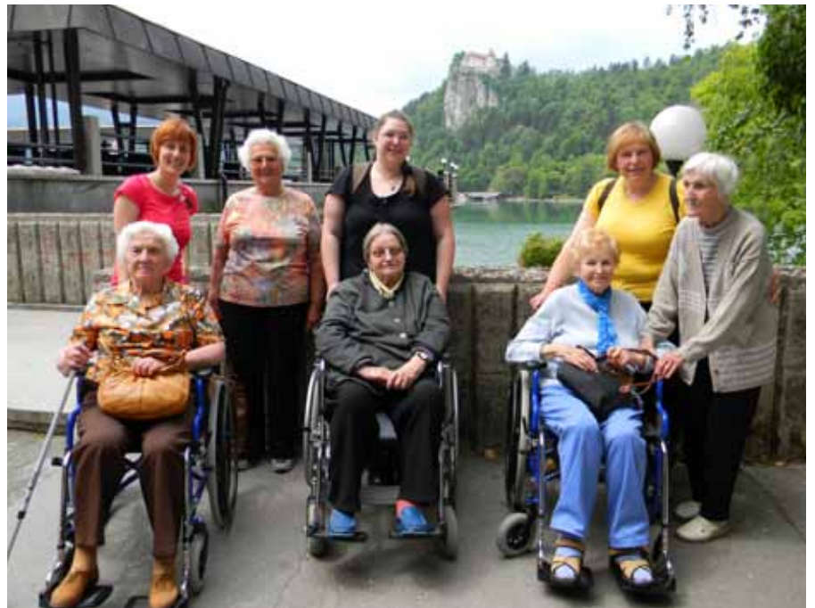
Za nami 1000 let star Blejski grad, mi pa še tako mladi!

Prijazno so nas pospremili v veliko jedilnico in postregli z zelo okusnim kosilom.