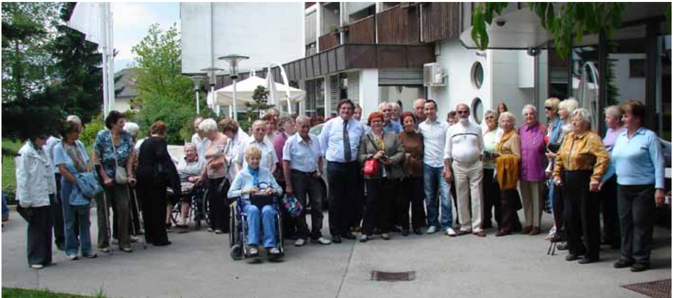
V Domu dr. Janka Benedika v Radovljici so nas prijazno sprejeli.