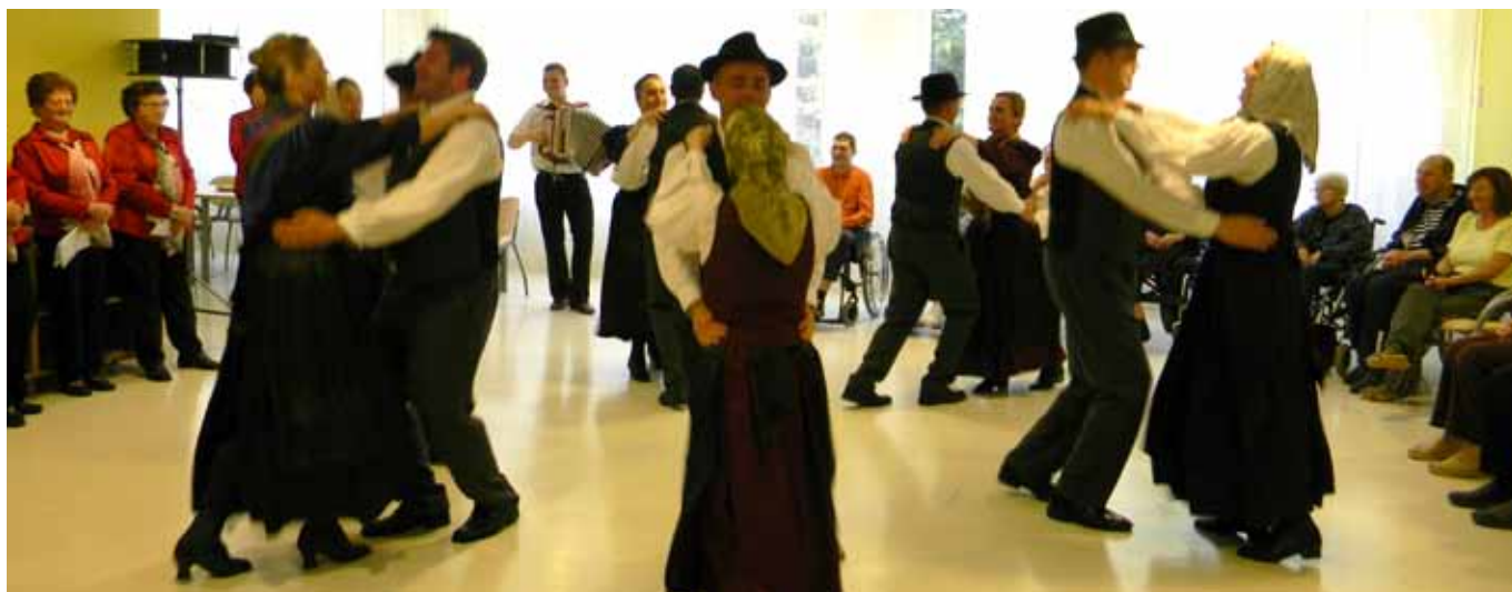
Plesalci folklorne skupine Oglarji so zatresli Zimzelen.

Zelo prijetno je bilo 14. aprila, ko so nas obiskali člani okteta TEŠ. Po večerji so nastopali v vseh bivalnih enotah. Najprej so s pesmijo razveselili stanovalce v četrtem nadstropju, nato pa so pevsko turnejo nadaljevali do prvega nadstropja, kjer so se ustavili za dalj časa in nam priredili pravo predstavo. Peli so prelepo, obenem pa nas zabavali s humornimi točkami. Nasmejali smo se do solz, kar je zelo zdravo v času vseh mogočih in nemogočih viroz. Smeh je pol zdravja! To še vedno velja, zato si ga le privoščimo.