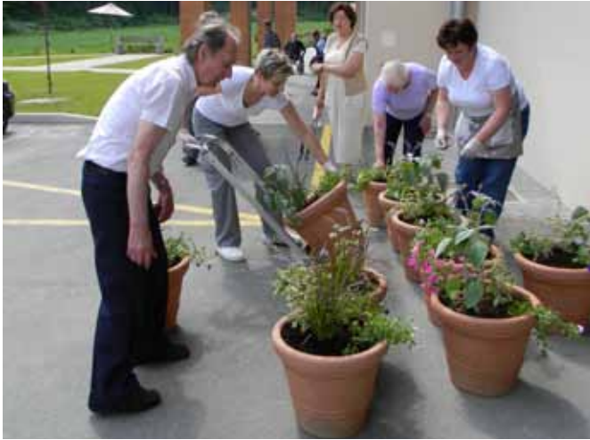
V juniju so gospodinje ob sodelovanju s stanovalci zasadile cvetlična korita, grede in uredile vrt.