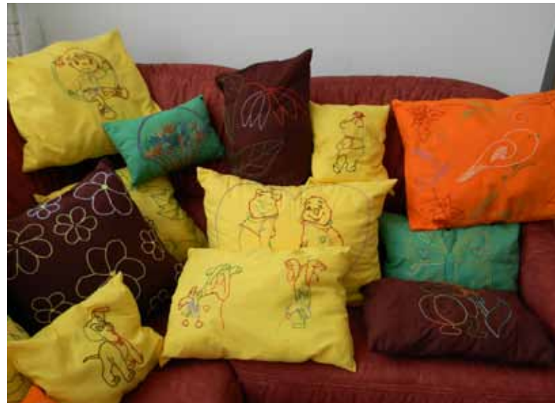
... blazine z različnimi motivi