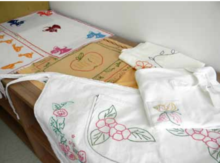
Prti, prtički, predpasniki ...