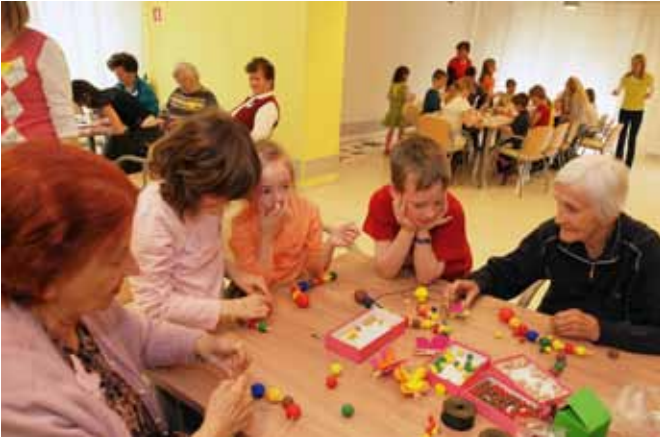
V delavnici so metulje ustvarjali otroci in naši stanovalci.

O pomenu tega projekta za Topolšico pa je spregovoril župan Šoštanja in poslanec državnega zbora Darko Menih, ki je med drugim poudaril, da bodo ljudje ob metuljevi poti lahko poleg metuljev občudovali tudi čudovito naravo v Topolšici in okolici z razgledom na celotno Šaleško dolino.