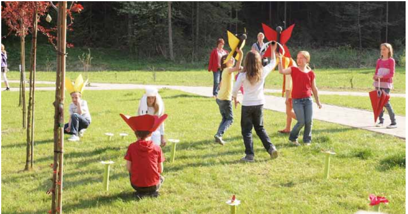
Zgodbica o treh metuljih na travniku PV Zimzelen v izvedbi učencev OŠ Topolšica